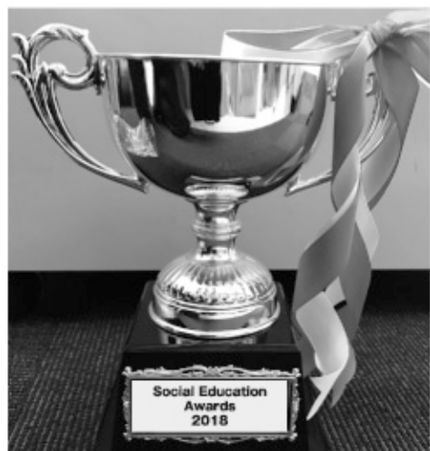
「Social Education Awards カップ (イメージ)」

この70余年、社会教育を「ハブ・中継地点・媒介」として、地域の多様な人と活動をネットワークしてまいりました。これからの社会をつくる基盤として社会教育の活動をより促進していくために、そのモチベーションの向上を目的として、「アワード」を構想しました。